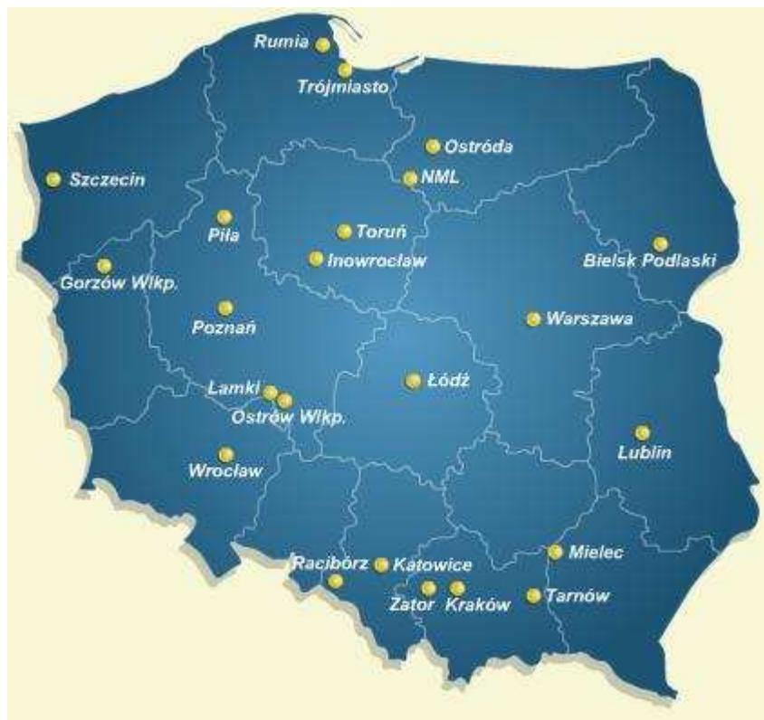
Miasta w których działają kluby scrabblowe